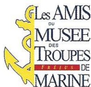
Association des amis du musée des Troupes de marine (AAMTDM)

Le musée des Troupes de marine est l'un des quinze musées de l'armée de Terre. L'institution militaire apporte son soutien financier à ce projet.