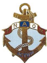
Fédération nationale des anciens d'outre-mer et anciens combattants des Troupes de marine (FNAOM-ACTDM)

L'EMSOME est également la maison-mère de l'Arme des Troupes de marine, garante des traditions et de l'esprit de corps des 18 000 personnels qui la composent. Le musée est rattaché à cet état-major qui est son autorité de tutelle.