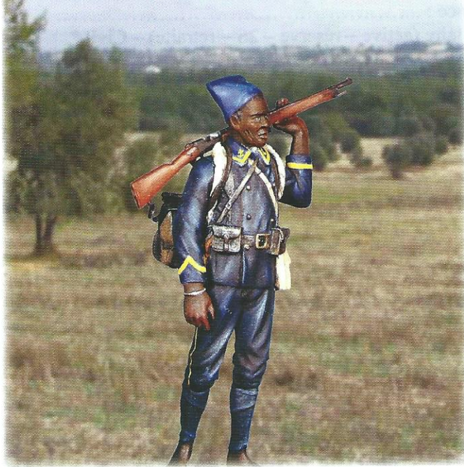
Figurine Metal Modèles montrant le paletot réglementaire et le Barda sénégalais. Collection Marc Morillon

Pour compléter cette image des tirailleurs en Orient, nous ferons appel à une figurine de plomb représentant un tirailleur sénégalais à la même époque. La chéchia est cette fois bleue foncé. Le paletot 1914 est du modèle réglementaire avec ses tresses jonquille. Notre tirailleur porte ici les jambières triangulaires ; il a ôté ses brodequins qui sont suspendus sur le côté du « barda sénégalais ». Avant de toucher des havresacs carrés, les tirailleurs roulaient leurs affaires dans une sorte de baluchon fait d'une pièce de toile dont les extrémités étaient torsadées et roulées derrière le cou. Sa façon de porter le fusil était familière des tirailleurs.