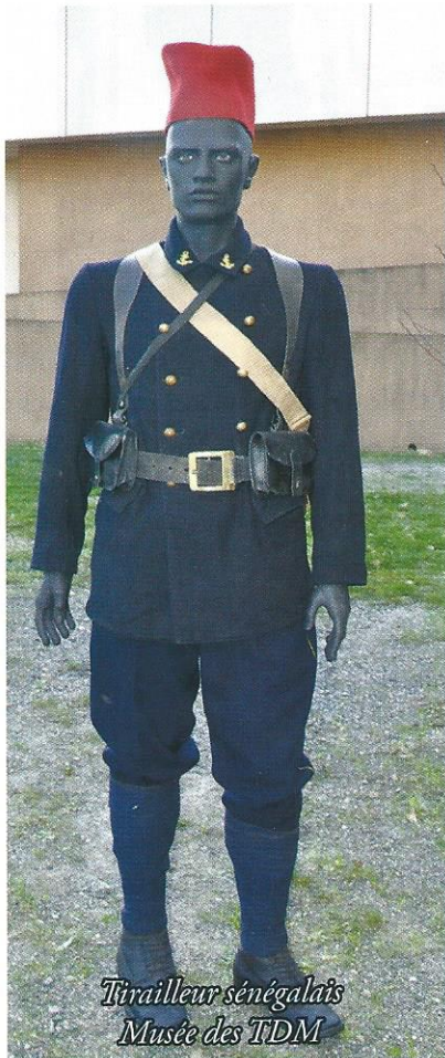
Tirailleur sénégalais Musée des TDM

La très riche collection d'uniformes et de mannequins du Musée des Troupes de Marine a pour objectif d'évoquer l'histoire et les grandes heures de l'Arme.