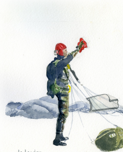
Le leader P.H. 04