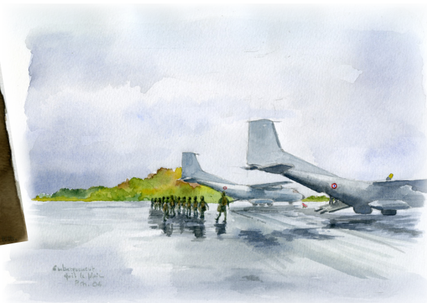
Subordonnés du 1er bataillon P.H. 04