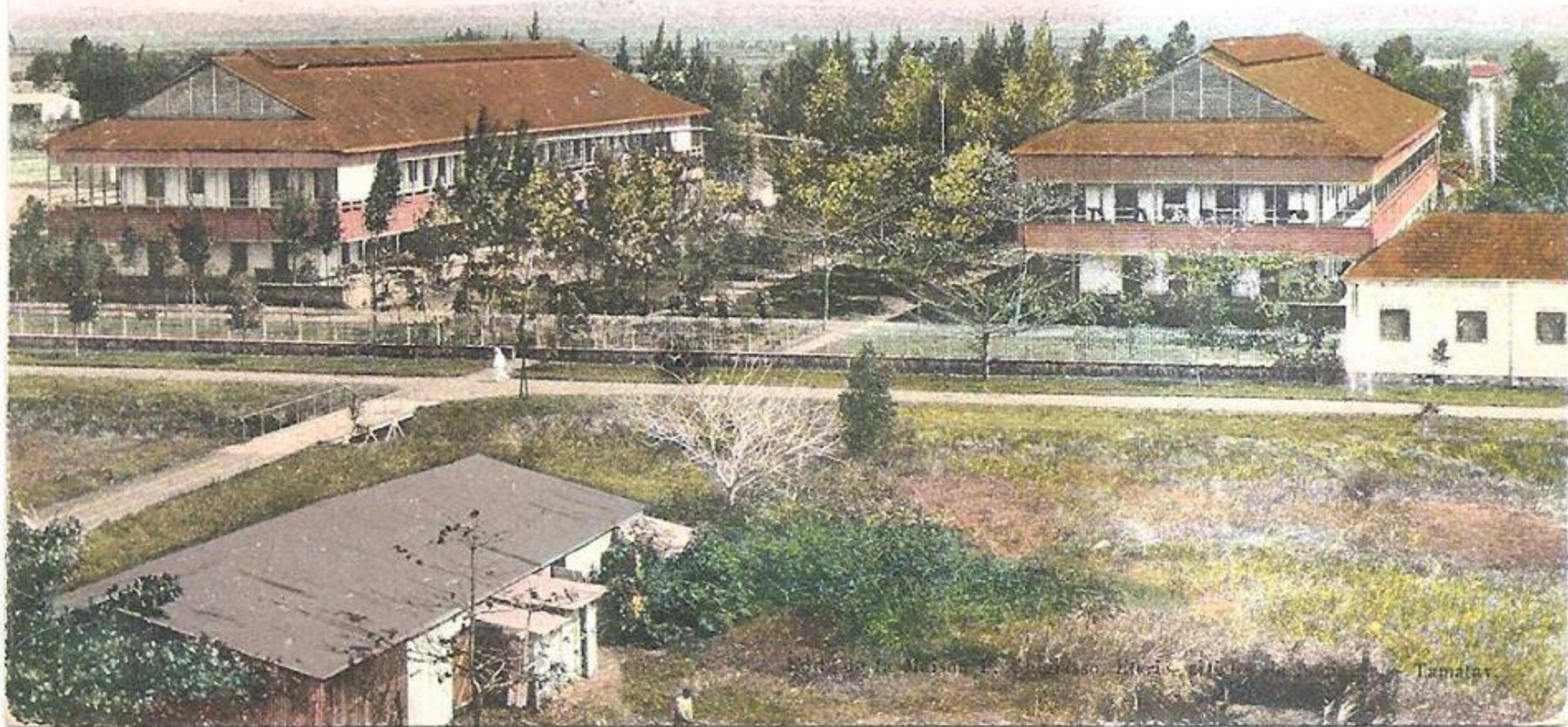
Photo de la Maison de l'Exposition Universelle de 1904 - Tamatave