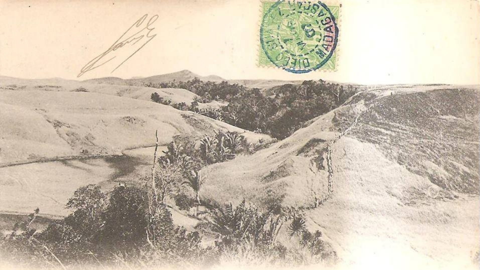
DIÉGO-SUAREZ. - Bataillon d'Infanterie Coloniale (Marche Militaire) - En Marche vers Ambavaki-Bé

Editeur Charifou Jeewa, Diégo-Suarez