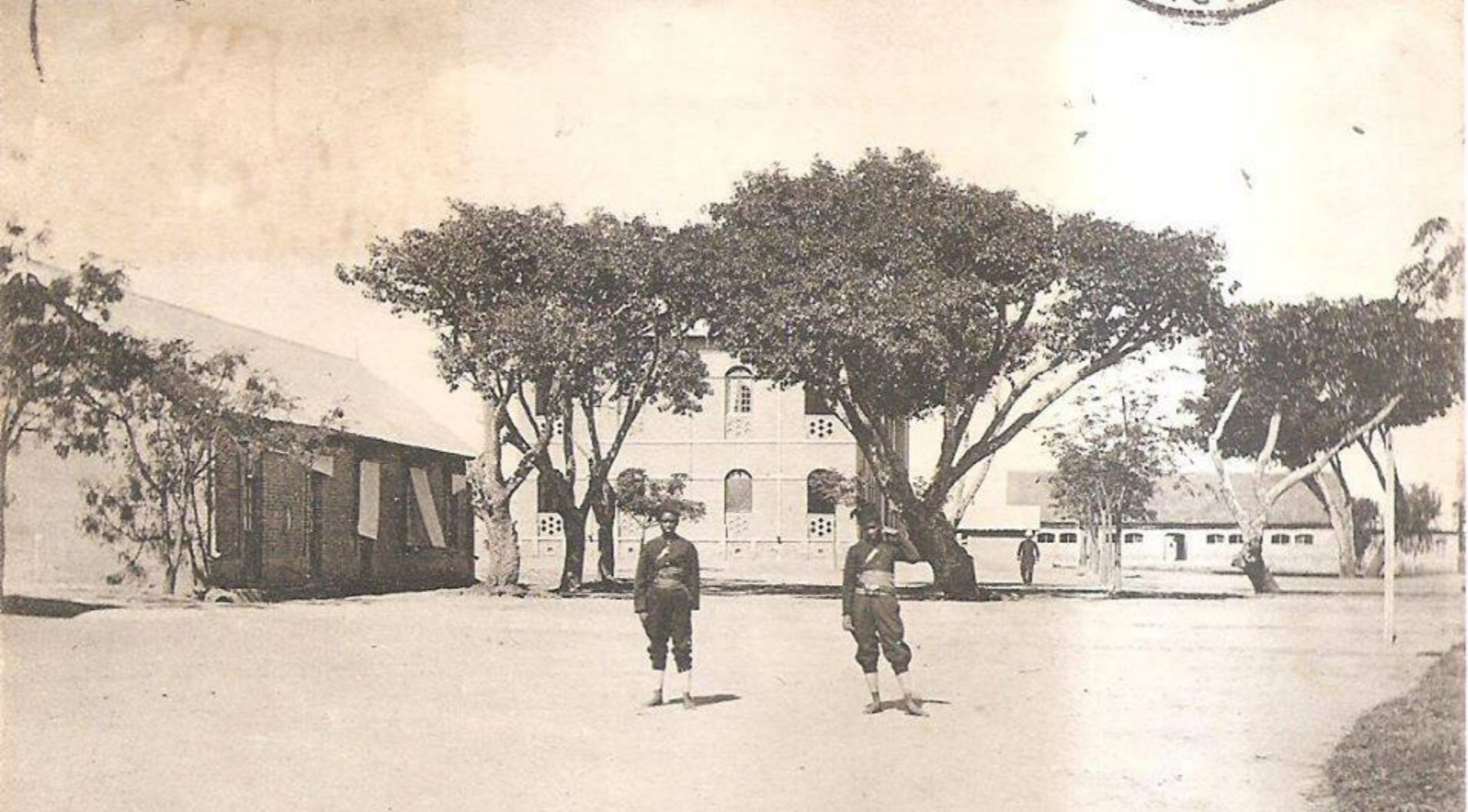
TANANARIVE - SOANIERANA — Entrée des Casernes de l'Artillerie Coloniale