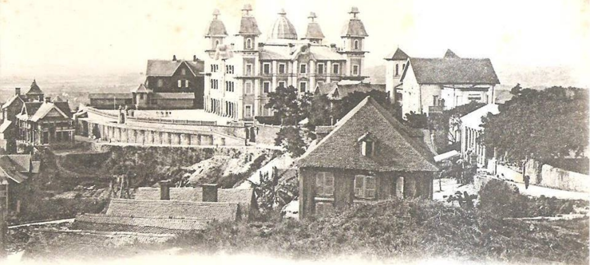
61. - MADAGASCAR. - TANANARIVE. - Le Palais du 1 er Ministre servant actuellement de Caserne au 13 e Rég t d'Infanterie Coloniale