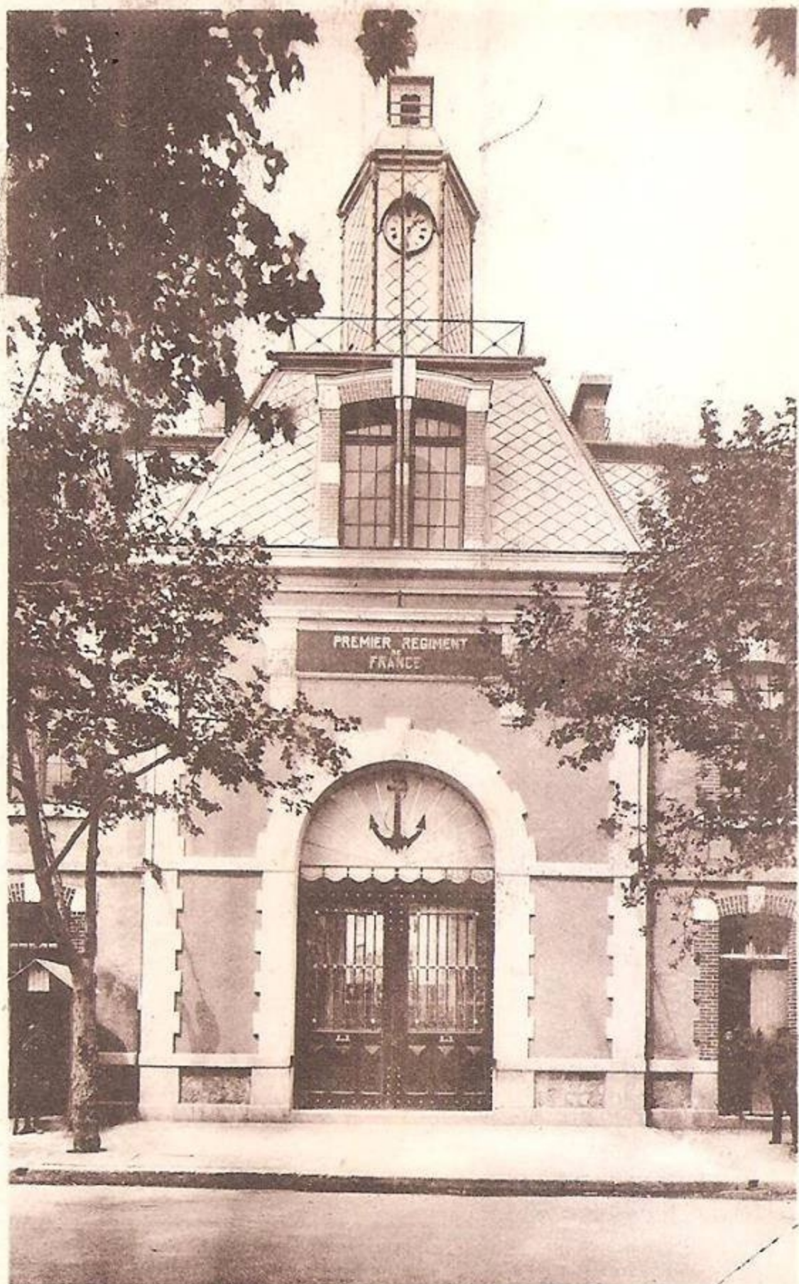
AIX-en-PROVENCE. - Caserne du R. I. C. M. - Entrée principale.